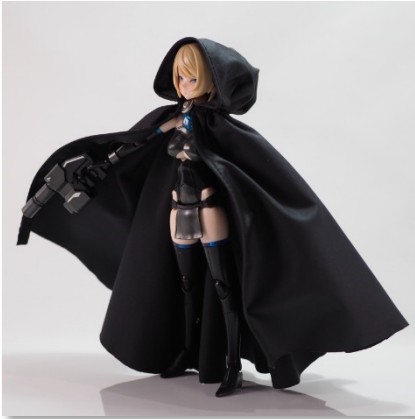
写真はブラック（GFM-M-SBL01）です

冒険者心を高ぶらせるフーディつきマント。襟元はらくらくスナップ式ワンタッチ。マントのふちに樹脂が仕込んであるからお好みのポージングでカッコよく固定できます