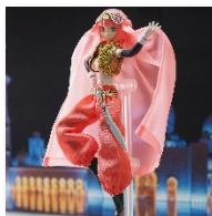
東方の踊り子 (メガミデバイス)