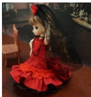
フラメンコ： 黒ベールとバタデコーラ

ミラドールではオビツ 11 系・メガミデバイス向けを中心として、以下のような作品がございます。 お手に取っていただける機会がありましたら、ぜひご検討ください