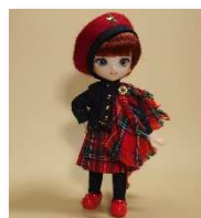
キルト衣装セット (オビツ 11)