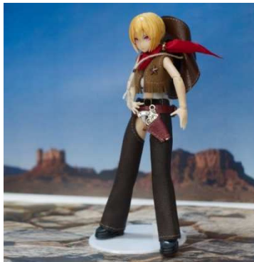
ライフルを着用していないガンマンスタイルでの着用例

開封後はお早目に内容物をご確認ください。不足の際はミラドルまでご連絡ください ※試作段階での撮影のため一部現物と異なる場合があります また制作ロットによって細部が写真と違うことがありますがお容赦ください