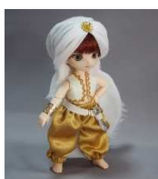
東方の王子 II (オビツ 11)