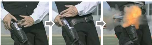
ウエスタンに登場する代表的なリボルバー「コルトシングルアクション」(1873)