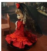
フラメンコ： 黒ベールとパタデコーラ (オビツ 11)

ミラドールではオビツ 11 系・メガミデバイス向けを中心として、以下のような作品がございます。お手に取っていただける機会がありましたら、ぜひご検討ください