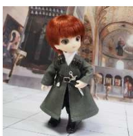
グルシア衣装： カルトリの戦士 (オビツ 11)